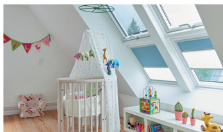
Siedlungshaus mit Anbau: Sanierung mit 15 neuen Dachfenstern