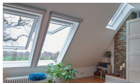
Spitzboden wird zum Schlafzimmer: 5 neue Dachfenster für Kinder- & Schlafzimmer

* zzgl. Zinskosten (0,75 % p. a.) und Kosten für Energieberater