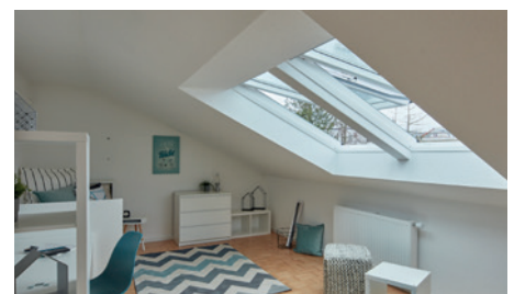
Jugendzimmer wird optisch vergrößert: Einbau von 2 neuen Dachfenstern